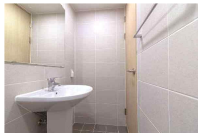
기숙사 방 화장실 전경(세면실과 샤워실 분리되어 동시 사용 가능)