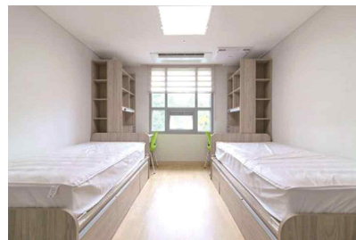
기숙사 방 전경(2인 1실)